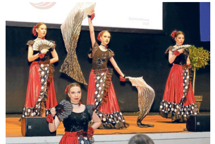
Zu einem Ausflug nach Spanien nahm die Tanzgarde aus Baiertal das Publikum der Sportlerehrung mit.